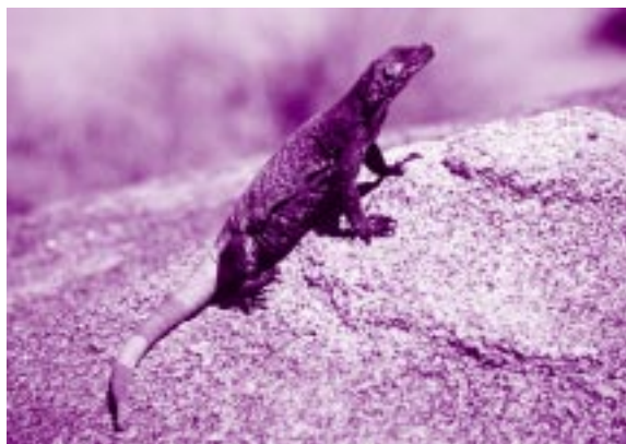
Kuščarji so eni redkih prebivalcev puščave Mojave.

Na obrobju puščave sva vstopila v razvpiti Las Vegas, mesto igralnic in rock 'n rolla. Tu je kraljeval v svojih največjih letih Elvis Presley – The King in ulice še vedno odzvanjajo v njegovih melodijah. V ogromnih igralnicah, v katerih nenehno žvenketajo kovanci iz igralnih avtomatov, sva začutila zlato mrzlico sedanjega časa. Tu se svet zelo konkretno, brez prisodob, vrti okoli denarja. Dame srednjih let pritiskajo na gumb avtomatov, gospodje umirjeno sedijo za igralnimi mizami. Nemir se jim izraža le na potnih nagubanih čelih, ko čakajo, na kateri številki rulete se bo ustavila kroglica. Mesto razvrata se prepozna tudi po ulicah, saj me je ustavilo kar nekaj zvodnikov in mi ponujalo ljubezen za denar. No, vsaj vsiljivi niso bili.