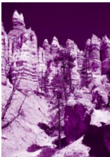
Kamniti stolpi v nacionalnem parku Bryce Canyon

Že prihod v Ameriko je bil drugačen, kot sva pričakovala: ni naju pričakala prijazna in sončna Kalifornija, pač pa naju je Los Angeles pozdravil s hladnimi hodniki letališkega podzemlja, na koncu katerih so naju čakali naveličanimi uradniki. Po formalnostih sva končno prišla na svež zrak in se počutila izgubljeno med 14 milijoni ljudi, kolikor jih živi v mestu in okolici. Le težko si je predstavljati to področje pred osem tisoč leti, ko so sem prišli prvi ljudje – Indijanci iz plemen Gabrieleni in Chumash. Španski misijonarji so tu ustanovili prvi misijon leta 1771. Eksplozijo prebivalstva je povzročila povezava Los Angelesa z vzhodom sredi 19. stoletja. Mesto se širi še danes in z njim vred tudi kriminal. V nekaterih soseskah je pogosto na meji kritičnosti; proti temu se mestne oblasti borijo s številnimi policijskimi patruljami. Neprijetno psihozo v 'dvomljivih' delih mesta sva občutila že prvi dan, ko sva se ustavila v naključnem motelu v latinski četrti. Za trdnimi rešetkami sprejemnega