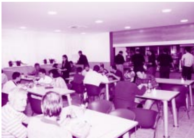
Menza je sedaj lepša in svetlejša.

V avgustu so se po nekaj tednih znova odprla vrata prenovljene institutske jedilnice. Prostor je sedaj mnogo prijaznejši in ustrežnejši. Sanitarije so popolnoma prenovljene, posodobljeno je prezračevanje, v jedilnem prostoru so nove mize in stoli, na oknih zavese. Dokončno podobo bo dobila jedilnica v naslednjih tednih, ko bodo na stene obesili še nekaj slik, dodali manjkajoče stole in nove pladnje. Z izboljšanjem prostorov so v podjetju Intereurop, ki posluje v teh prostorih, izpopolnili še svojo ponudbo, saj je sedaj na voljo več solat. Nekateri pravijo, da ima sedaj tudi vsa druga hrana boljši okus.