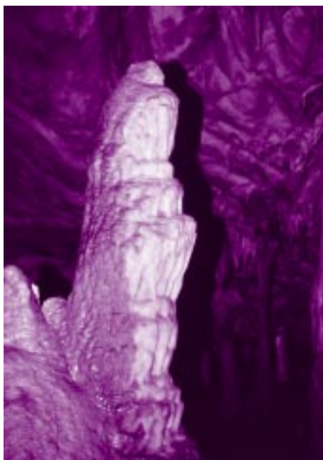
Stalagmit v Postojnski jami

Poznanje vsebnosti stabilnega izotopa ogljika ^{13}\text{C} in radioaktivnega ^{14}\text{C} ter njuna porazdelitev v okolju je izrednega pomena pri preučevanju kroženja ogljika. Za boljše razumevanje tega kroženja smo nad Postojnsko jamo in v njej vzorčevali zrak, rastline, ogljikov dioksid v tleh, organsko snov, jamski zrak, pronicajočo vodo in kapnike. V vseh vzorcih smo določili vsebnost stabilnega in radioaktivnega ogljika. Raztopljeni ogljik v pronicajoči vodi izvira iz atmosferskega ogljikovega dioksida, vrste rastlin in njihovega fotosintetskega mehanizma, razgradnje organske snovi v tleh in raztapljanja obstoječega apnenca v jami. Ob vstopu pronicajoče vode v jamo se začnejo izločati karbonati, ki tvorijo različne kapniške tvorbe, med katerimi so stalagmiti najbolj primerni za geokemijske in izotopske raziskave. Pri naši raziskavi nas je predvsem zanimalo, kako se