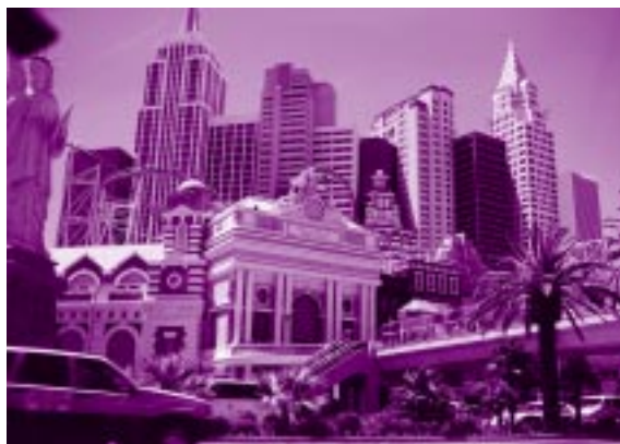
Las Vegas - mesto igralnic in rock 'n rolla

okenca je v naju buljil Vietnamec in naju spraševal: "Do You need a room? It's only 30 bucks!" Glede na najino utrujenost nama pač ni ostalo drugega kot da plačava tistih 30 dolarjev za sobo in še dodatnih 10 za garancijo ključa. Zaradi