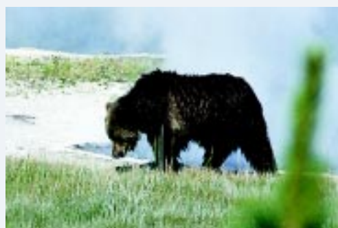
Grizli v nacionalnem parku Yellowstone

Grizli spada med rjave medvede, ki so največja vrsta kopenskih zveri. Razvil se je verjetno iz družine črnih medvedov. Nekoč je bil razširjen v zahodnem delu ZDA, na Aljaski, v Kanadi in Mehiki. Danes ga najdemo v delih Montane, Wyominga, Idaha, Washingtona, Aljaske in Kanade.