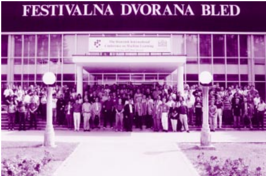
Konferenca ICML'99 se je udeležilo več kot 200 udeležencev iz 30 držav.

podarstva dobili veliko podpore pri organizaciji konference: tako je bil generalni sponzor ICML-99 HERMES SoftLab, med sponzorje pa se je uvrstilo še več drugih slovenskih podjetij. Konferenca se je udeležilo tudi nekaj predstavnikov teh podjetij.