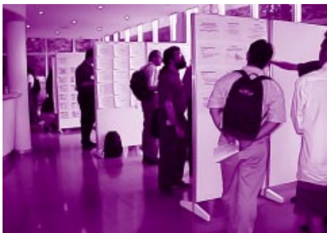
Utrinek s skupne poster sekcije konferenc ICML-99 in ILP-99, Festivalna dvorana, Bled, 27. junij 1999

Konferenca se je udeležilo približno 200 udeležencev iz 29 držav. Največ jih je bilo iz ZDA, in sicer več kot 40, malo manj kot 30 iz Velike Britanije, veliko pa jih je prišlo tudi iz Avstralije, Japonske in Nemčije. Udeležencev iz Slovenije je bilo približno 30. Konference so se udeležili strokovnjaki na področju strojnega učenja, ki prihajajo tako iz akademskih raziskovalnih institucij, kot iz industrije. Tako smo imeli nekaj udeležencev iz podjetij AT&T, Daimler Chrysler ter Microsoft, zadnji dve pa sta organizacijo konference tudi finančno podprli. Nasploh smo iz gos-