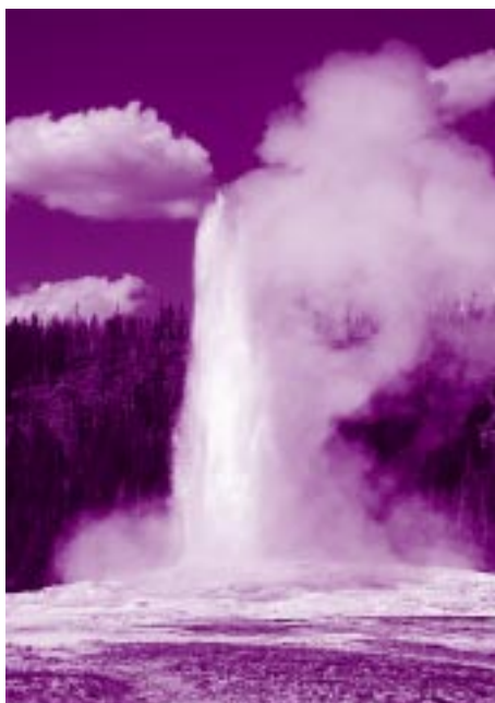
Old Faithful izbruhne vsakih 80 minut (nacionalni park Yellowstone).

daljšega sprehoda v divjino, je treba imeti dovolj enje čuvajev. Presenetilo naju je tudi njihovo načelo ohranjanja procesov v naravi in ne trenutnega stanja. Tako na primer ne gasijo požarov, ki jih zaneti strela, kajti to je naraven proces čiščenja in kroženja biosistemov.