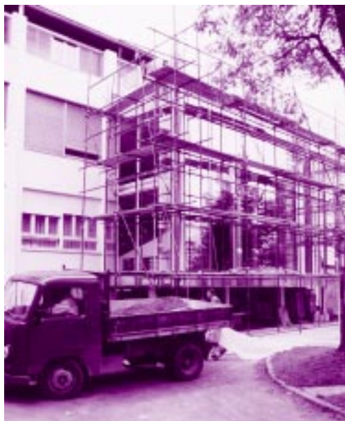
Gradbena dela so se potegnila v jesen.

Julija smo na inštitutu začeli prenovo in razširitev stare avle. Razlogov za to je bilo več, vsekakor pa je bil med najpomembnejšimi vse večja utesnjenost obiskovalcev na raznih prireditvah.