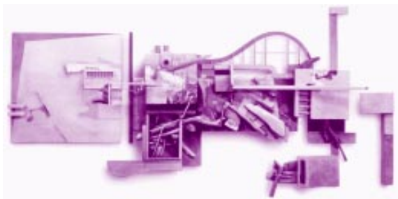
Marko Tušek: "Et in Arcadia ego", 1998-99, les, papir, akril..., 240 x 100 x 15 cm

njegovega likovnega pristopa: težnjo po dekorativnem, očem prijetnem učinkovanju likovnih del, ki v mnogočem spominja na rešitve srednjeevropske secesijske umetnosti in prav tako denimo tudi na znamenitega avstrijskega umetnika Hundertwasserja, s katerim si Vinko Tušek deli željo po združevanju slikarskih rešitev z arhitekturnimi kompozicijskimi zasnovami in spoznanje, da likovna umetnost služi tudi zato, da nam polepša naše vsakdanje okolje.