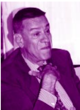
prof. dr. Pierre-Gilles de Gennes

14. junija letos je Institut "Jožef Stefan" obiskal Nobelov nagrajenec za fiziko profesor Pierre-Gilles de Gennes , sodelavec College de France, Pariz, Francija. Obisk gosta je bil pripravljen v sodelovanju z Institut Français Charles Nodier. Uglednega gosta je sprejel